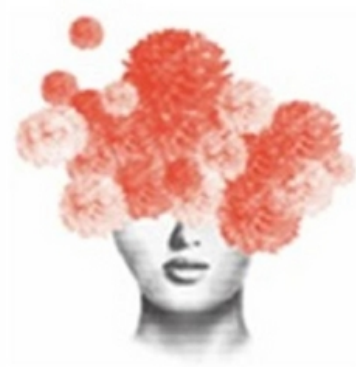
Tipo de Sinal: FIGURATIVO