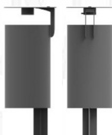
Figura 3.3 Figura 3.4