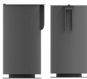
Figura 2.3 Figura 2.4