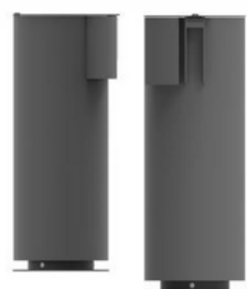
Figura 4.3 Figura 4.4