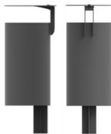
Figura 1.3 Figura 1.4