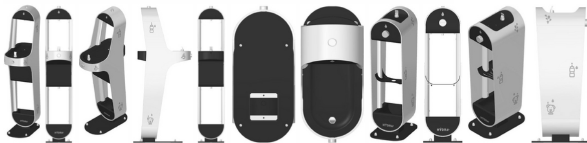
Figura 1.1 Figura 1.2 Figura 1.3 Figura 1.4 Figura 1.5 Figura 1.6 Figura 1.7 Figura 2.1 Figura 2.2 Figura 2.3 Figura 2.4