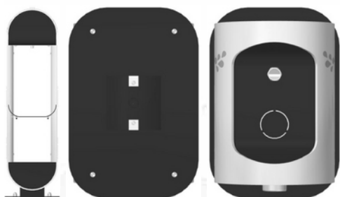
Figura 2.5 Figura 2.6 Figura 2.7