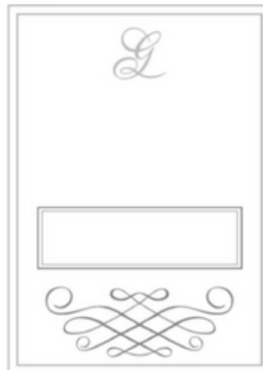
Tipo de Sinal: FIGURATIVO