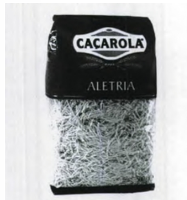
CAÇAROLA - ALETRIA