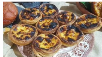
PASTEL DE TIGELADA