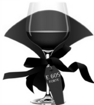
E 605 FORTE