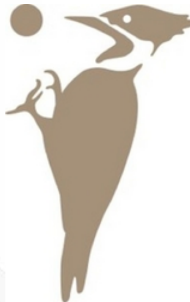
Tipo de Sinal: FIGURATIVO