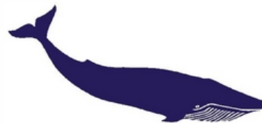
Tipo de Sinal: FIGURATIVO