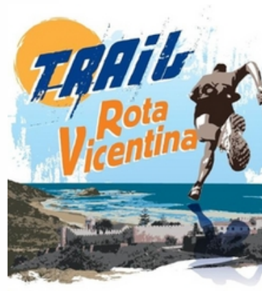
TRAIL ROTA VICENTINA