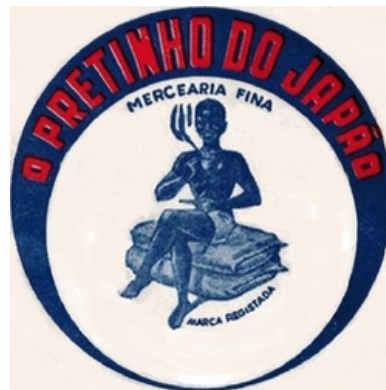
O PRETINHO DO JAPÃO