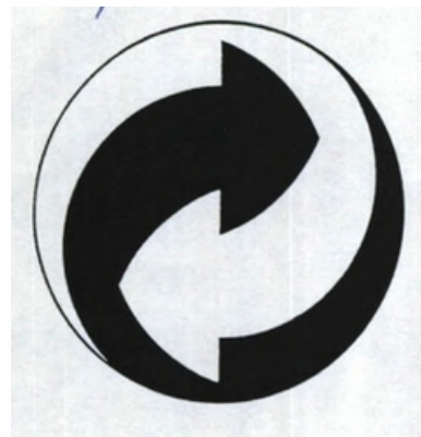
Tipo de Sinal: FIGURATIVO