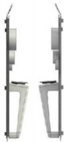
Fig 1.2 Fig 1.3