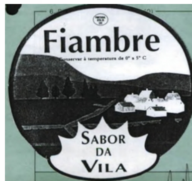
SABOR DA VILA