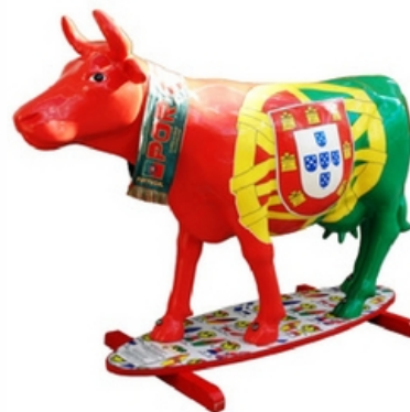
Tipo de Sinal: FIGURATIVO