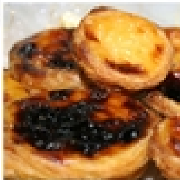
TRINCA & PETISCA ALMADA