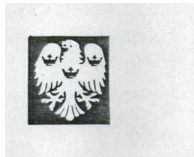
Tipo de Sinal: FIGURATIVO