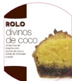
ROLO DIVINOS DE COCO