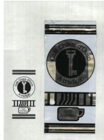
CAFÉ CHAVE D'OURO A TRADIÇÃO