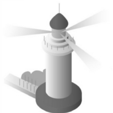
Tipo de Sinal: FIGURATIVO