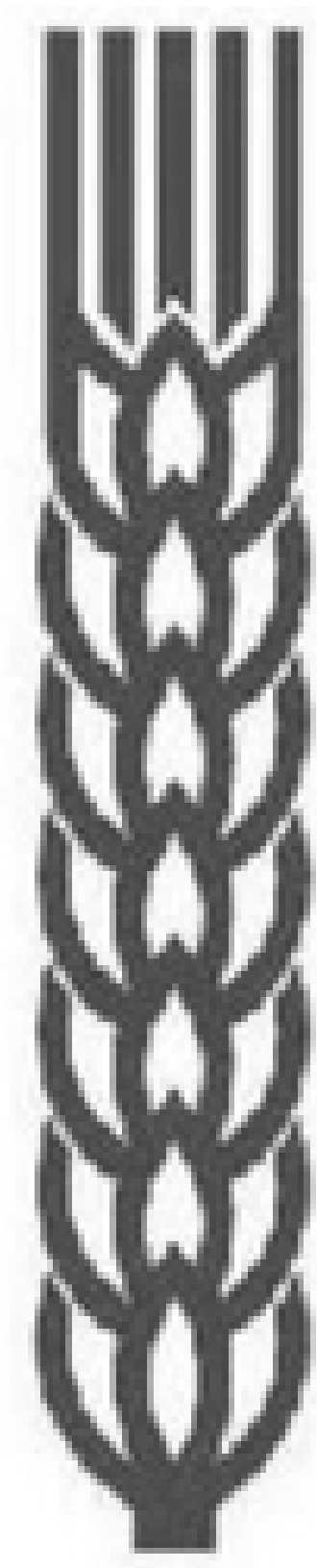
Tipo de Sinal: FIGURATIVO