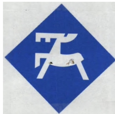
Tipo de Sinal: FIGURATIVO