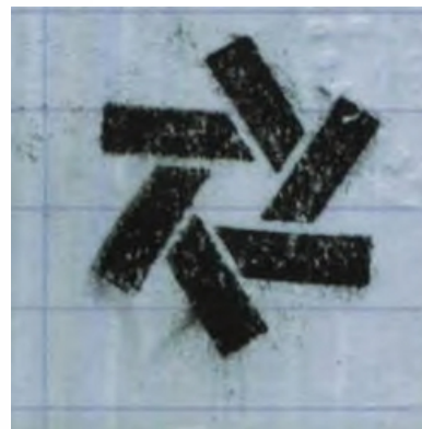
Tipo de Sinal: FIGURATIVO