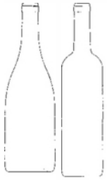
Fig. 1.1 Fig. 2.1