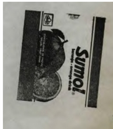
SUMOL LARANJA ORANGE DRINK