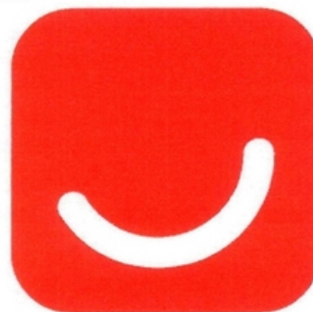
Tipo de Sinal: FIGURATIVO